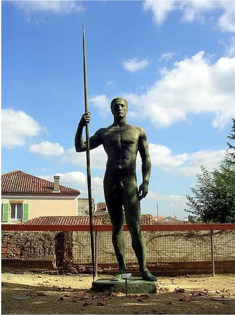
« Zeus » ou « L'Athlète au javelot » Musée Despiau-Wléric Mont-de-Marsan