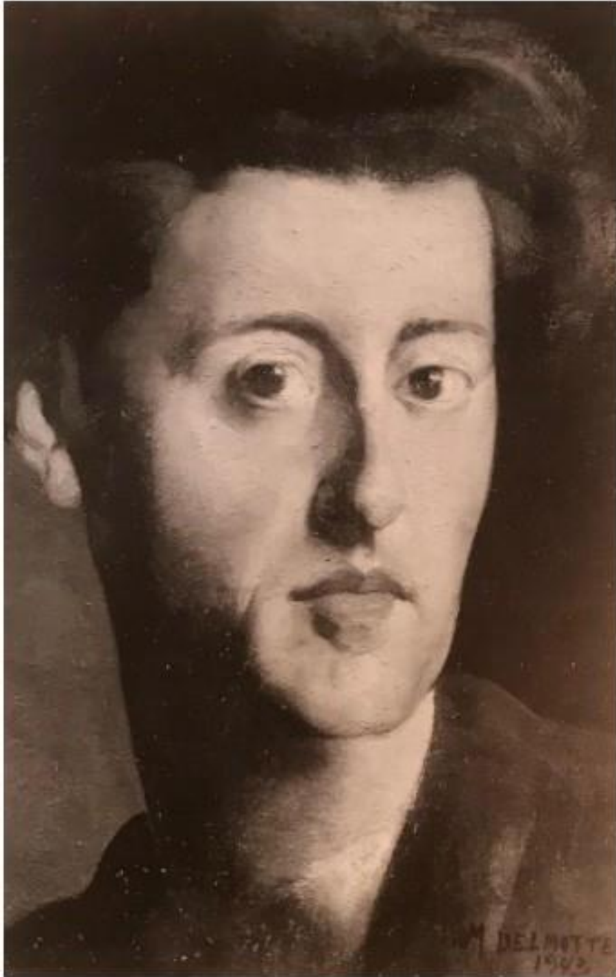
Autoportrait, 1943, huile sur panneau, 45 x 30 cm