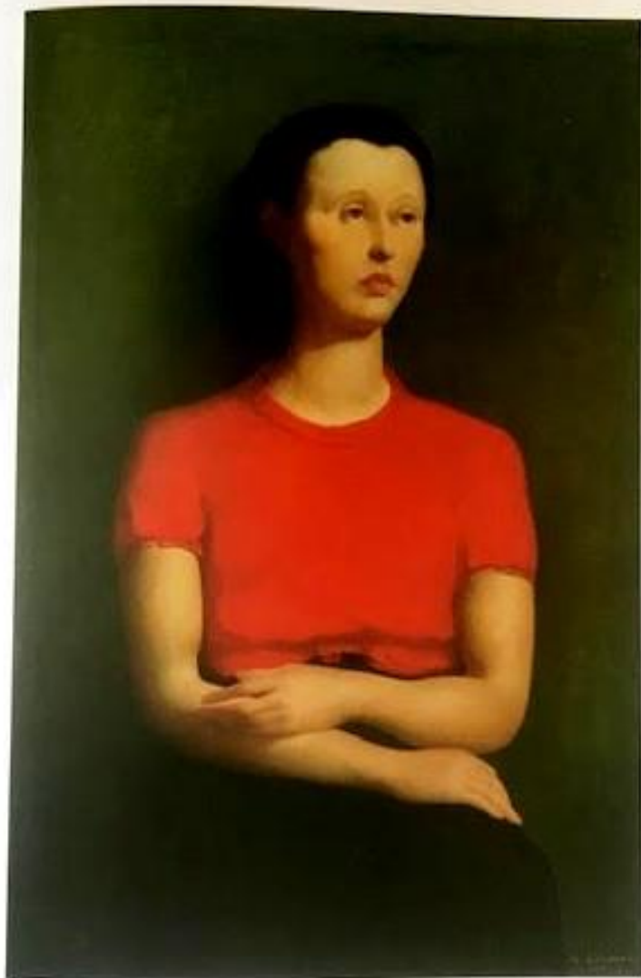
La blouse rouge, 1935, huile sur toile, 115 × 77 cm