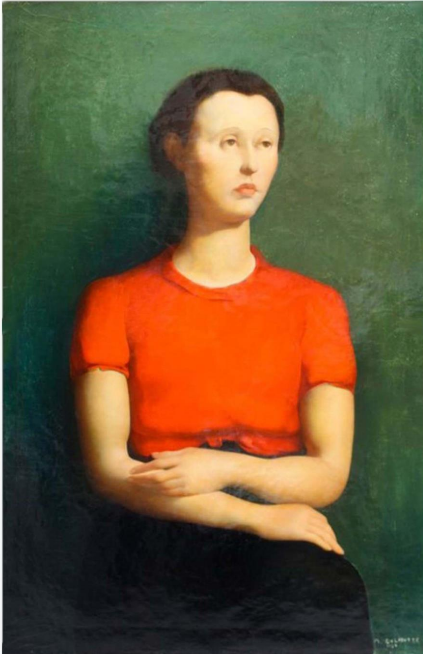
"La blouse rouge" HST : 115 x 77 cm 1935