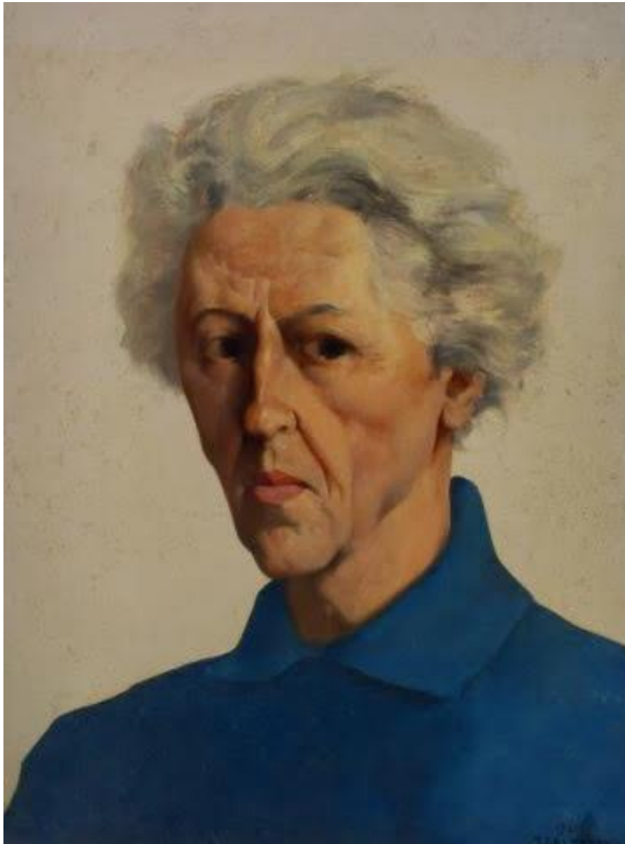
Autoportrait, 1965, huile sur panneau 80x60 cm