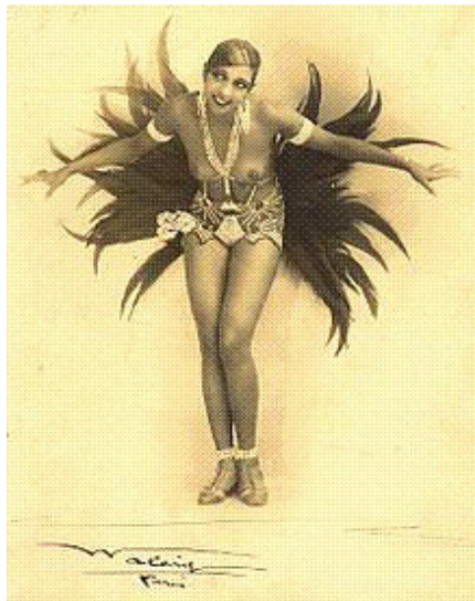
Josephine Baker , figure emblématique des « années folles » en France.

Ces vingt années connaissent également un formidable élan intellectuel, artistique et technique qui voit s'accélérer un véritable renouveau culturel et se développer le cinéma , la radio , l' aéronautique et l' automobile . Ces années de tensions extrêmes