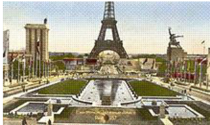
Panorama du site de l'Exposition Universelle de 1937 depuis le Palais de Chaillot : le pavillon de l' Allemagne nazie surmonté d'un aigle, à gauche, fait face à celui de l' Union soviétique surmonté de L'Ouvrier et la Kolkhoziennne .

En Italie , Benito Mussolini obtient les pleins pouvoirs en 1922, met en place un régime nationaliste, autoritaire et expansionniste , et se rapproche progressivement de l'Allemagne, jusqu'à signer avec elle le Pacte d'acier en 1939 et à entrer dans la guerre.