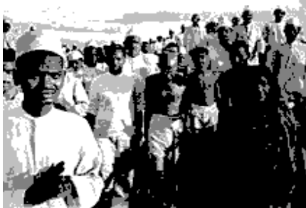
Marche du sel en Inde

En Irlande , à l'instar des pays de l' Europe de l'Est nés du démantèlement des empires autro-hongrois et russe , le parlement irlandais faisant valoir du droit des peuples à disposer d'eux-mêmes adopte une déclaration d'indépendance , le 21 janvier 1919 . Le refus du gouvernement britannique d'accéder aux revendications irlandaises déclencha une guerre d'indépendance qui aboutit en juillet 1921 à la création de l' État libre d'Irlande et à la guerre civile irlandaise .