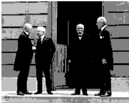
Le Conseil des Quatre lors de la conférence de paix réunissant les vainqueurs de 1918 : le Britannique David Lloyd George , l'Italien Vittorio Orlando , le Français Georges Clémenceau et l'Américain Woodrow Wilson .