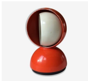
Vico MAGISTRETTI 1920-2006 Lampe « Éclisse » - 1960 - H : 18 x Ø12 cm