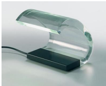
J. et G. COLOMBO (1930-1971) "Acrilica" 1963

Lampe en perspex transparente et lumière fluorescente