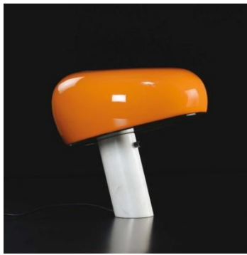
Achille et Pier CASTIGLIONI Lampe "Snoopy"- Édts Flos - 1968