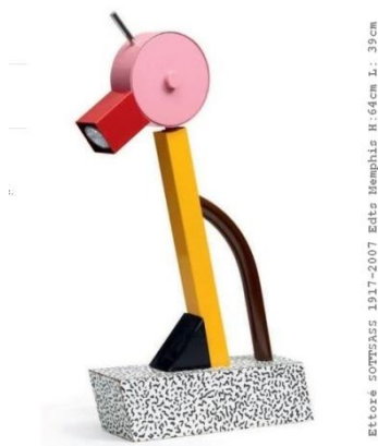
Ettore SOTTASS 1917-2007 Lampe « Tahiti » Edts Memphis H : 64 x L : 39 cm