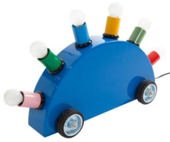
Martine BEDIN née en 1957 Lampe « Super » pour Memphis 1981 L : 45 x H : 30 cm