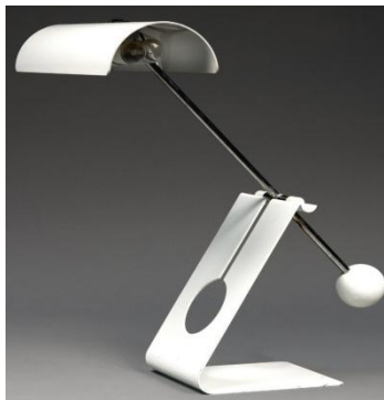
Sabine CHAROY Lampe à balancier Métal laqué blanc Vers 1970 H 55 cm L 30 cm