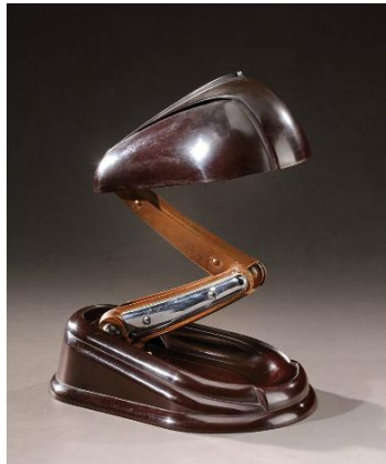
Lampe JUMO dite "Bolide" 1945