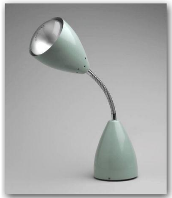
Lampe Max BILL 1908-1994 Muséum of Modern Art NYC *