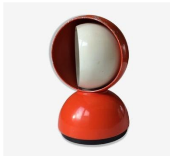
Vico MAGISTRETTI 1920-2006 Lampe « Éclisse » - 1960 - H : 18 x Ø 12 cm