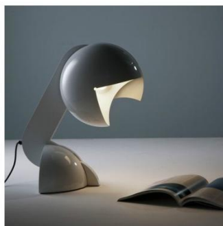
Gaë AULENTI née en 1927 "Ruspa" 1968