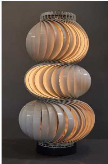
Olaf von BOHR Lampe "Médusa" circa 1968