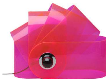
SuperStudio pour Poltrona Lampe "Gherpe" – 1967 Six bandes de plastique de couleur H : 40 x L : 64 cm