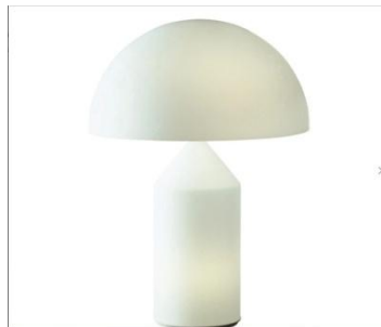
Vico MAGISTRETTI 1920-2006 Lampe Atollo 236 - H : 35 x Ø 25 cm « Compasso d'Oro 1979 »