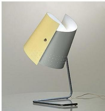
Leister GEIS Lampe T5 G Fabriquée par Heifez Manufacturing