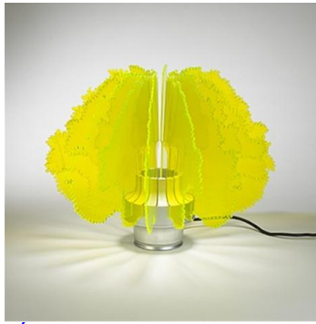
Énio LUCINI pour GUZZINI "Cespuglio" 1970 H: 33 cm x Ø 45 cm