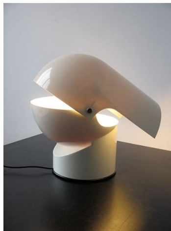
Gaë AULENTI née en 1927 "Piléo" 1972