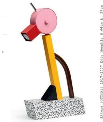
Ettore SOTTASS 1917-2007 Lampe « Tahiti » Edts Memphis H : 64 x L : 39 cm