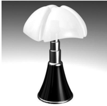
Gaë AULENTI née en 1927 "Pipistrello" 1965