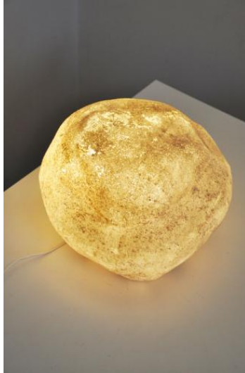
André CAZENAVE Lampe "Doria"- Atelier A Fiberglass / 1965