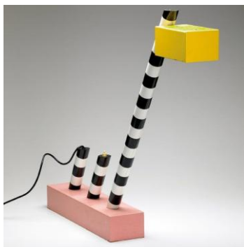
Michèle de LUCCHI né en 1951 Lampe « Océanic » pour Memphis 1981 H : 75 x L : 90 x p : 10 cm