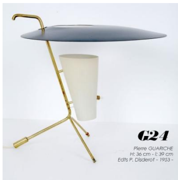
Pierre GUARICHE Circa 1952