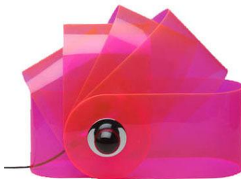
SuperStudio pour Poltrona Lampe "GHERPE" 1967. Six bandes de plastique rouge, maintenues par deux vis en plastique noir. H:40 x L:64 cm