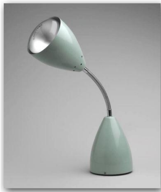
Max BILL (1908-1994) Museum of Modern Art NYC *